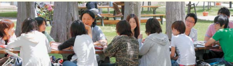
秋田杉の森に囲まれメタセコイアの大木がそびえるキャンパスでは、晴れた日は戸外での授業も多く、学生のアイデアを引き出すきっかけにもなっている。