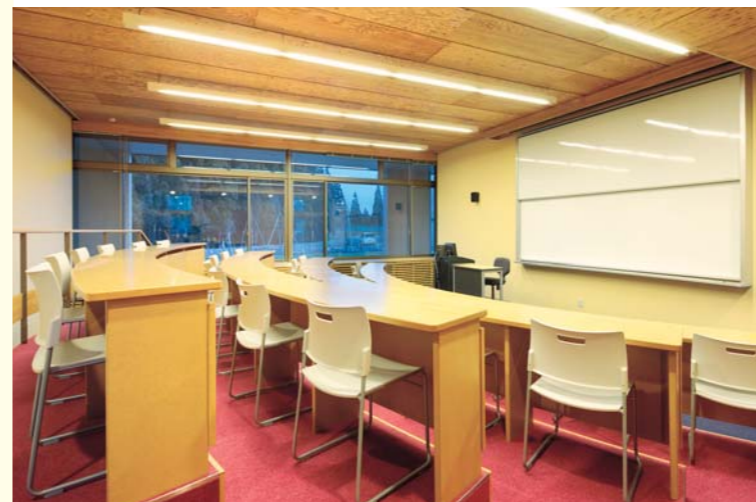
プレゼンテーションルーム / イス:ベン、教卓

グローバル・ビジネス課程の「ケーススタディ」など、自分の意見を積極的にプレゼンテーションし、世界で競う企業人としてのスキルを磨く授業に利用される。