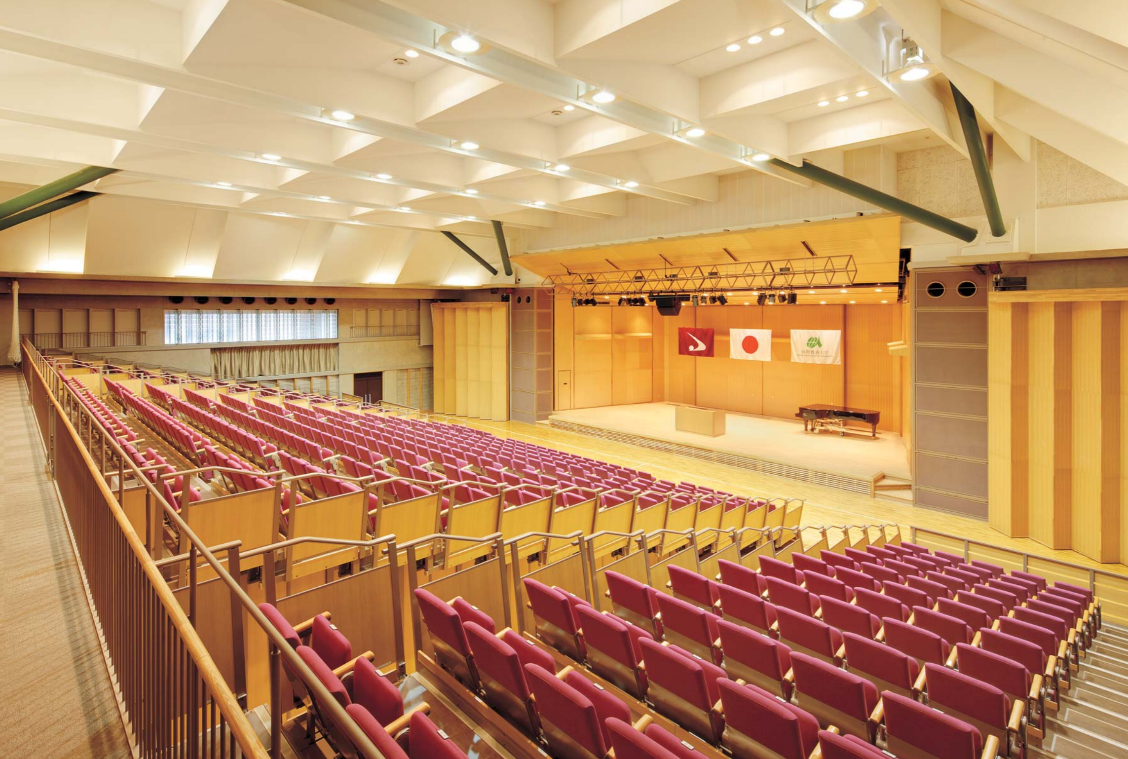
多目的ホール／移動観覧席「テレスコープスタンド」: AHP-A8204-23PTA 534席、専用スタッキングチェア(メモ台付) 124席

舞台奥の扉を開けるとガラス越しに桜並木が望める。 通訳ブースが2つあり、二言語対応が可能。