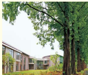
講義棟(新講義棟) 外殻のコンクリート造りの中に木造を入れる「入れ子構造」。建物の耐久性を高めながら、木造の温かさと陽光の明るさが調和した空間をつくり出している。

※国際教養: International Liberal Arts. 学長自身の構想による高等教育の新理念で、1.外国語とりわけ英語で自由かつ積極的にコミュニケーションできる 2.幅広い教養を身につけ様々な視点から物事を深く捉えられる 3.グローバル化に対応する自分自身の専門分野を見出して知識を深めることをめざす。