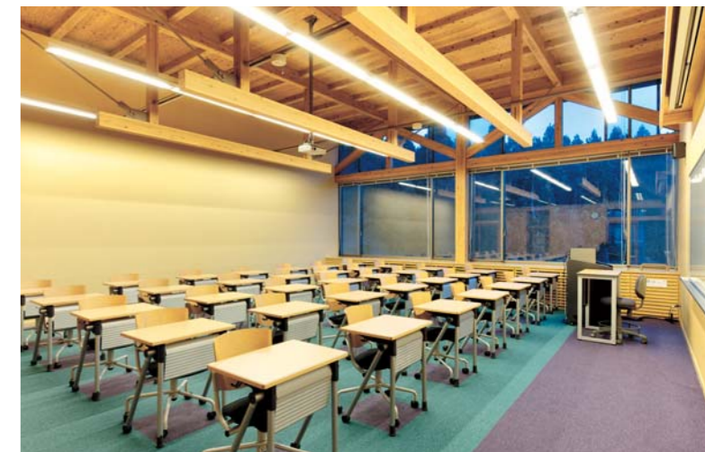
教室 / デスク:SCM-700、教卓