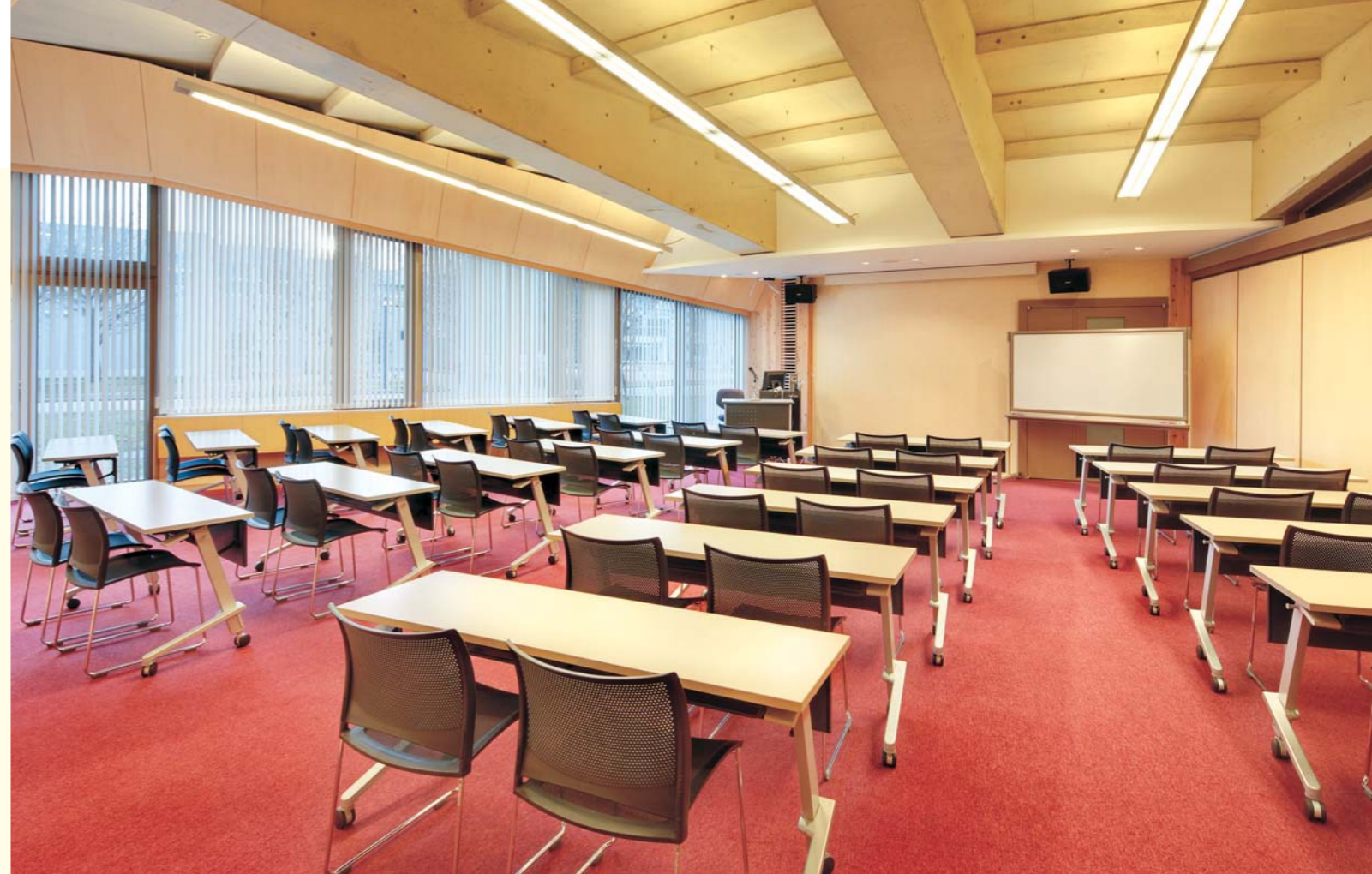
D101教室 / テーブル:CTZ、イス:ルッシュ、教卓