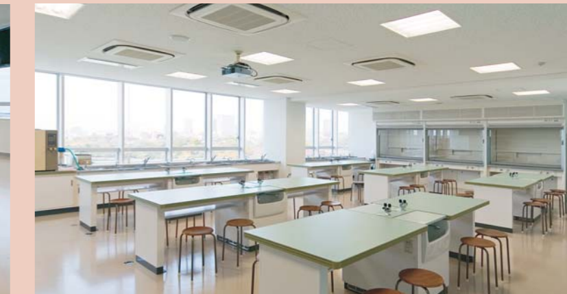
本館7F・化学実験室／実験台、丸イス：AS-31