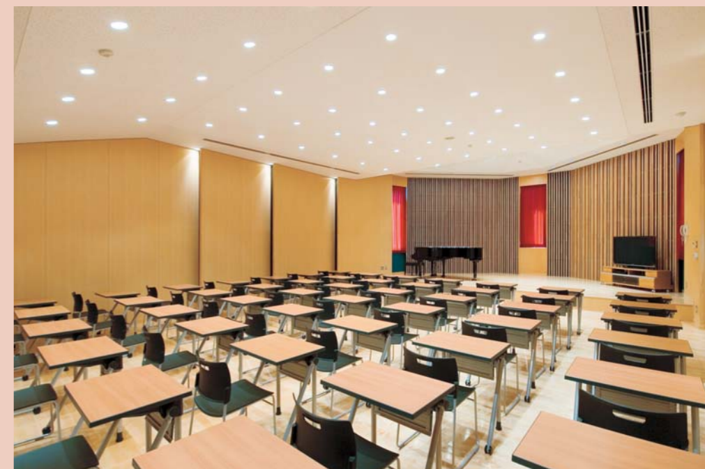
本館1F・音楽室 / デスク:SCM-752J-1T/B、イス:PEN-S