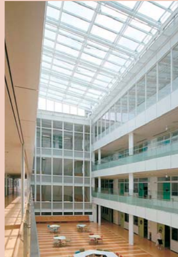
4～7F吹き抜け、4F生徒ホール