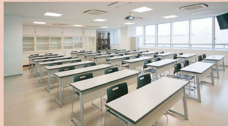
本館7F・社会科教室／デスク：SCM-300-2T、イス：PEN-S