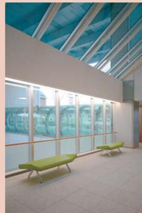
本館EVホール／ベンチ