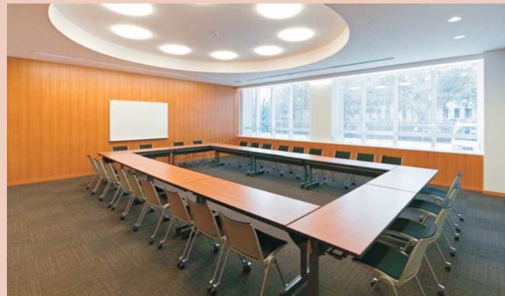
本館1F・会議室／テーブル：CTN3-450L、イス：DUNE・F-SC