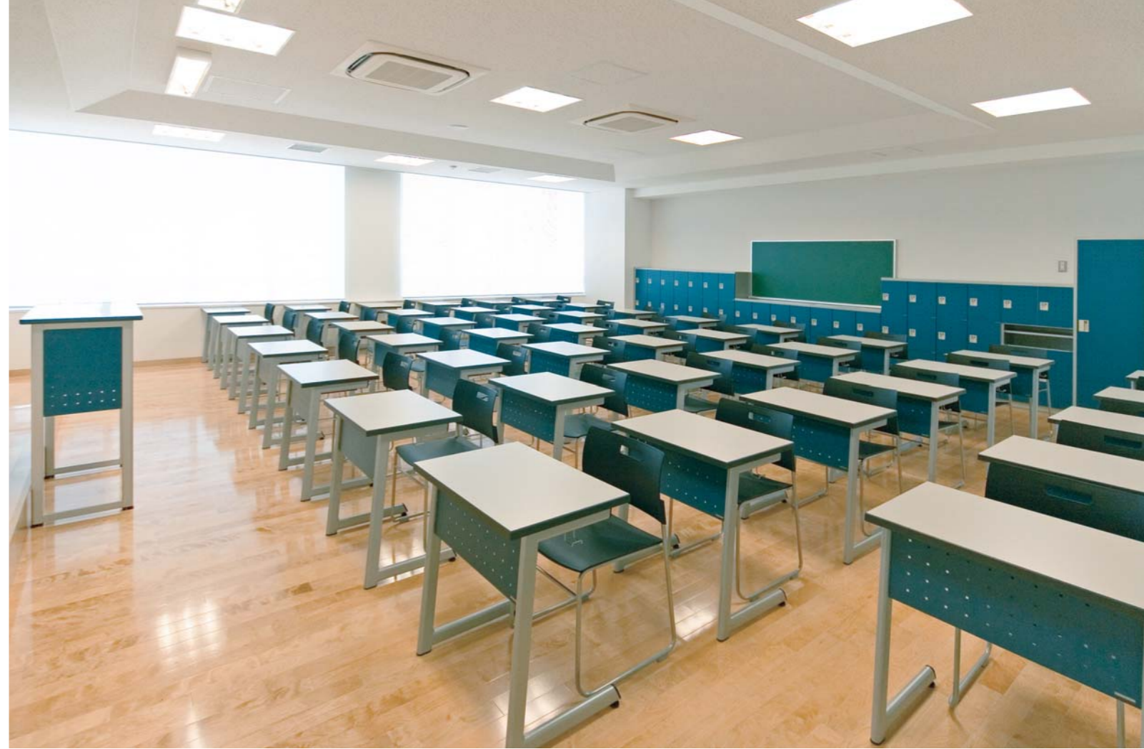
本館・教室(高校)／デスク：SCM-300-1T、イス：PEN-S、教卓：S-50、ロッカー(特注品)、ダストボックス(特注品)、掃除用具入れ(特注品)