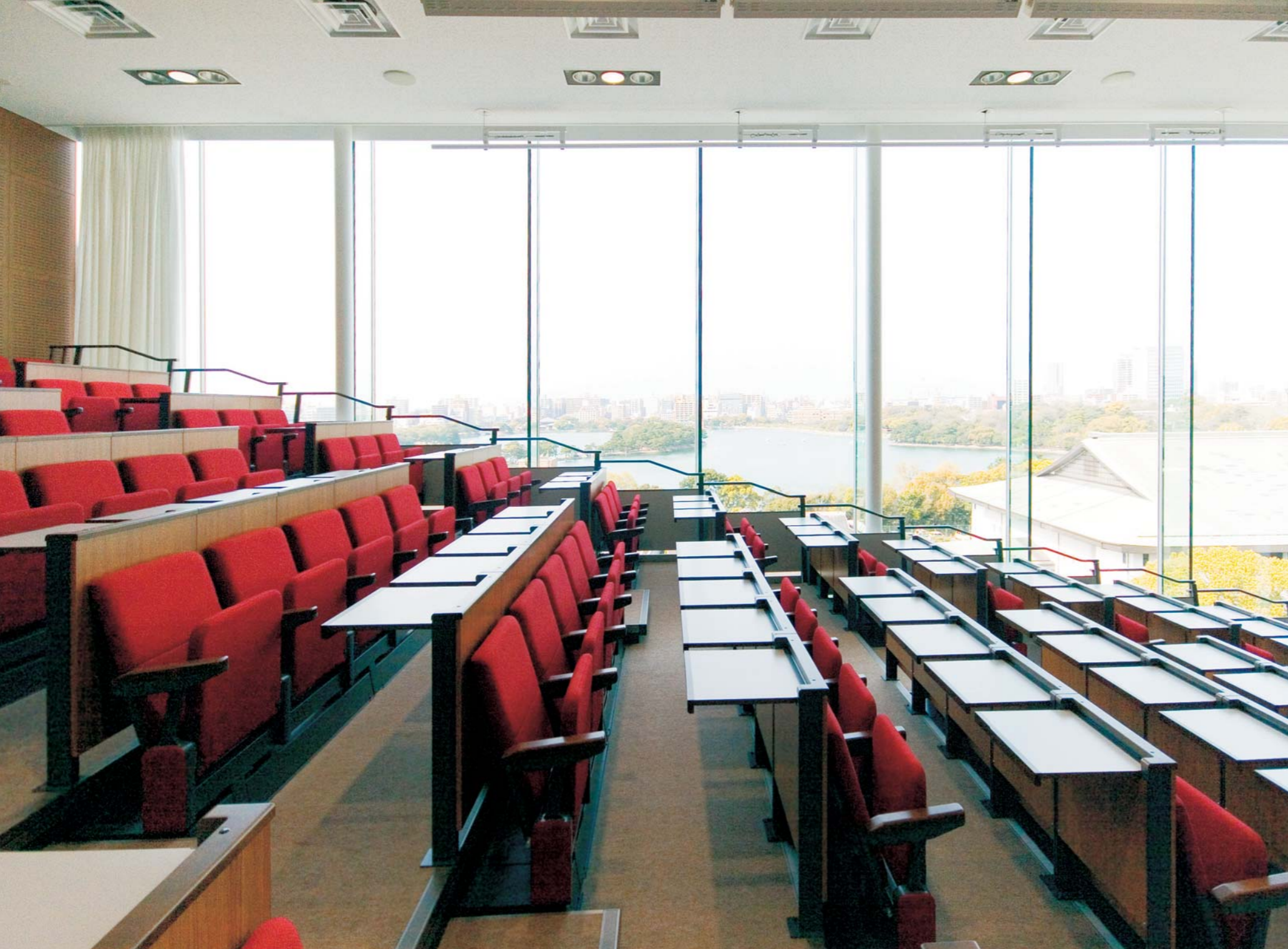
福岡県 福岡大学附属大濠中学校・高等学校