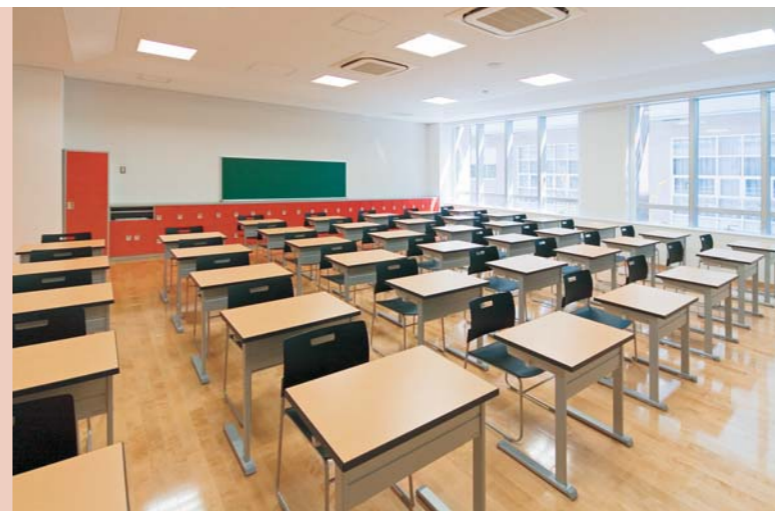
本館・教室(中学)／デスク：SCM-400-1T(H705・645mm)、PEN-S(SH425・380mm)、教卓：S-50、ロッカー(特注品)、ダストボックス(特注品)、掃除用具入れ(特注品)

教室のデスクは中学と高校で異なる。中学はJIS号数対応で、2種類の高さを用意。高校はスクエアドット入りカラー幕板のデスクで、同じしつらえの教卓や特注ロッカーなど、デザイン性豊かで統一感のある学習環境を整えている。