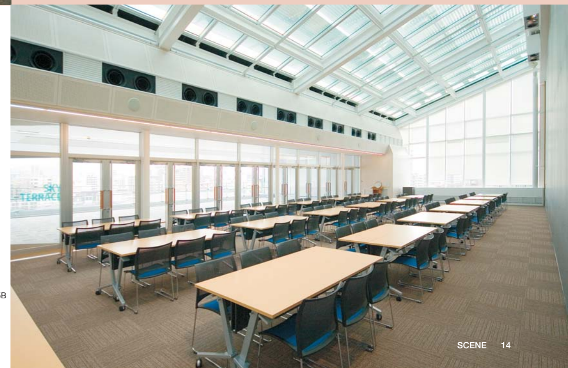
本館6F・大会議室 / テーブル:CTZ-1845B イス:LUSH-SX