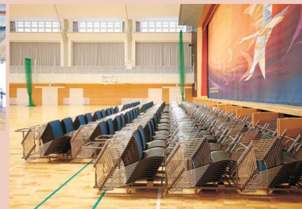
2000脚を超えるスタッキングチェアをステージ下に収納する専用台車 体育館3F・アリーナ / LUSH-SX、ステージ下台車